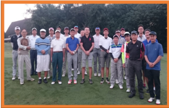
ご参加有難うございました！！