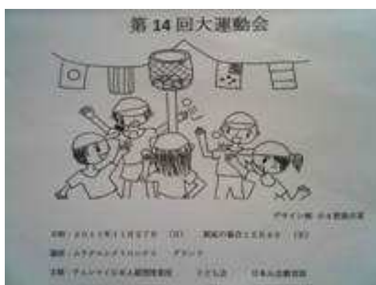
運動会式次第の表紙

11月27日(日)ムラタエレクトロニクス社のグラウンドにて第14回大運動会が開催されました。補習校の生徒とレインボークラブ、子ども会の幼児ならびに保護者、講師の先生が一丸となって爽やかな晴れ空の下、楽しく元気に運動会が行なわれ、私たちも一緒に楽しむことが出来ました。運動会への参加を通じ、我々チェンマイ日本人会の会費の一部が将来を担う子どもたちの活動のために微力ですがお手伝いできていることをうれしく感じました。是非会員の皆様にも火焰樹を通じて知っていただければと思います。