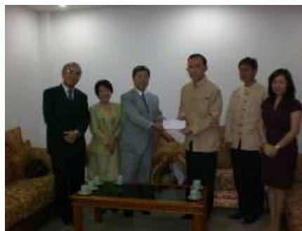
11月17日チェンマイ県庁にて5万B寄付