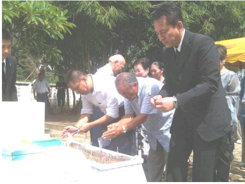
慰霊塔の前にてお線香をお供え(8月15日)