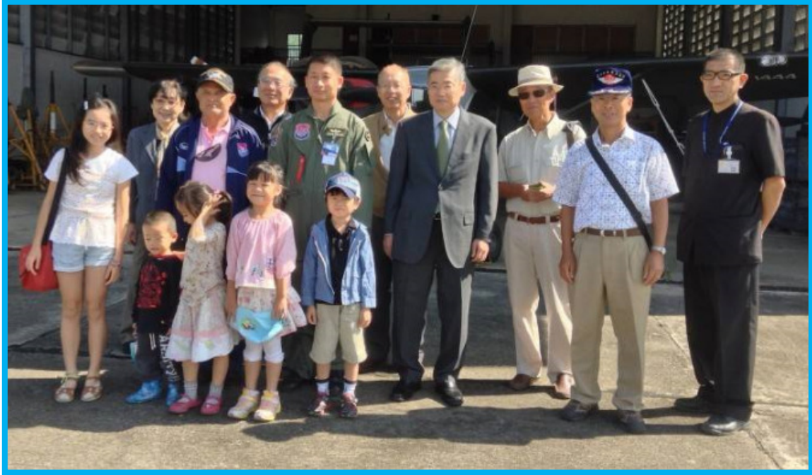
チェンマイ日本人補習授業校・レインボークラブより